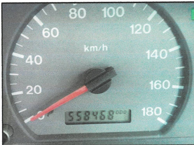
ก่อนใช้รถยนต์